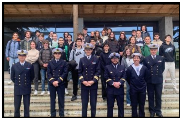
© Lycée Louis de Foix et FREMM Aquitaine