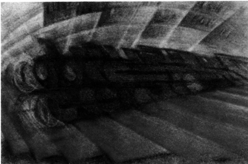
dynamisme d'un train , 1912 de l'artiste futuriste italien L. RUSSOLO.

Russolo veut peindre le mouvement, la vitesse.