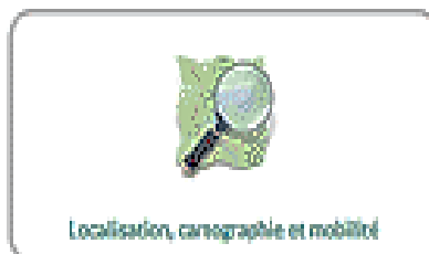
Localisation, cartographie et mobilité