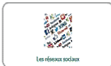
Les réseaux sociaux