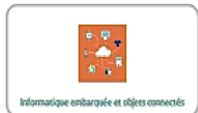
Informatique embarquée et objets connectés