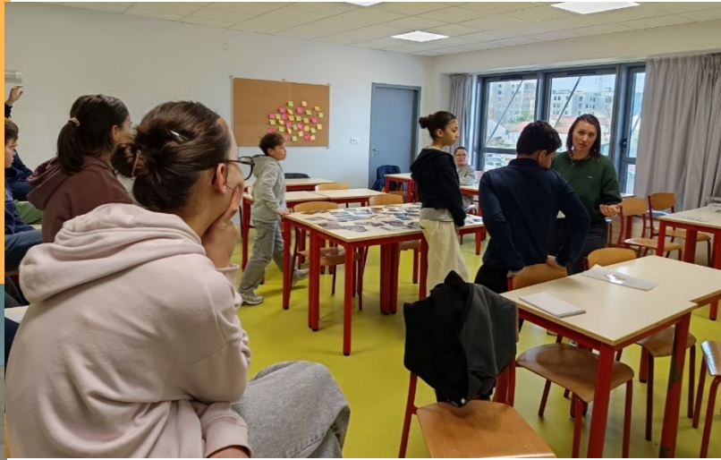
Intervention du centre social Ocsygène sur les stéréotypes véhiculés par les images dans les médias, auprès des classes de 6e