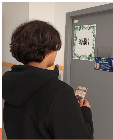
Jeux "éclaireurs de l'égalité", conçu pour l'occasion : rallye sur des figures historiques (mixtes) ayant œuvré pour davantage d'égalité entre les filles et les garçons.

Une semaine pour prendre le temps du recul, se projeter, apprendre, rire, jouer et partager un moment festif tou.s/tes ensemble. ■