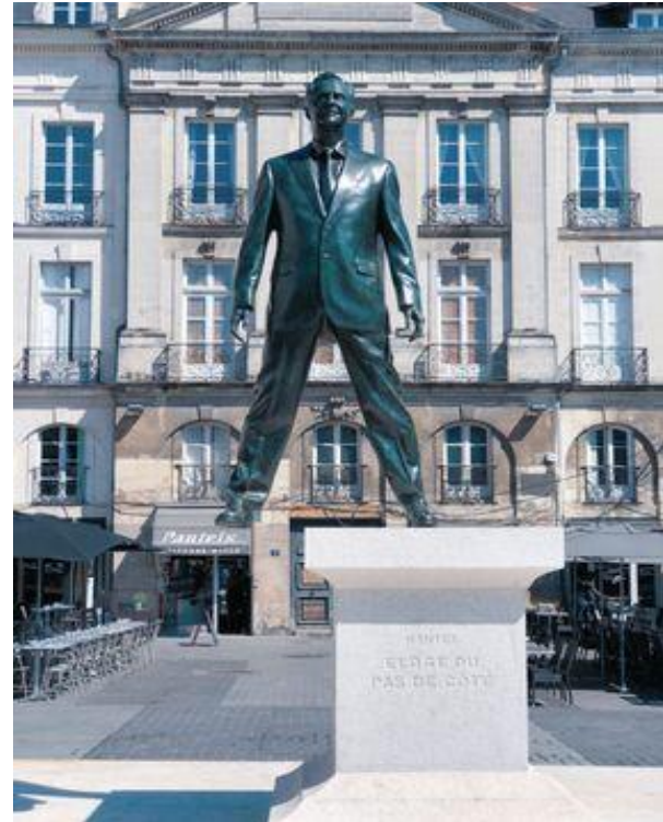
« Le pas de côté » Philippe Ramette