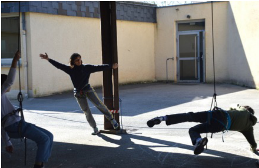
Projet en cours : Une création, un territoire - Corps & Graphies, collège Bellevue, Guémené-Penfao, 44. Mars 2026.

Mené avec plusieurs classes du collège, et porté par des élèves volontaires devenus ambassadeurs du projet, ce parcours s'inscrit dans une démarche résolument interdisciplinaire associant EPS, arts plastiques et lettres. Il prévoit également des échanges avec les écoles du territoire, afin de favoriser une continuité et un véritable élan collectif autour de la création artistique.