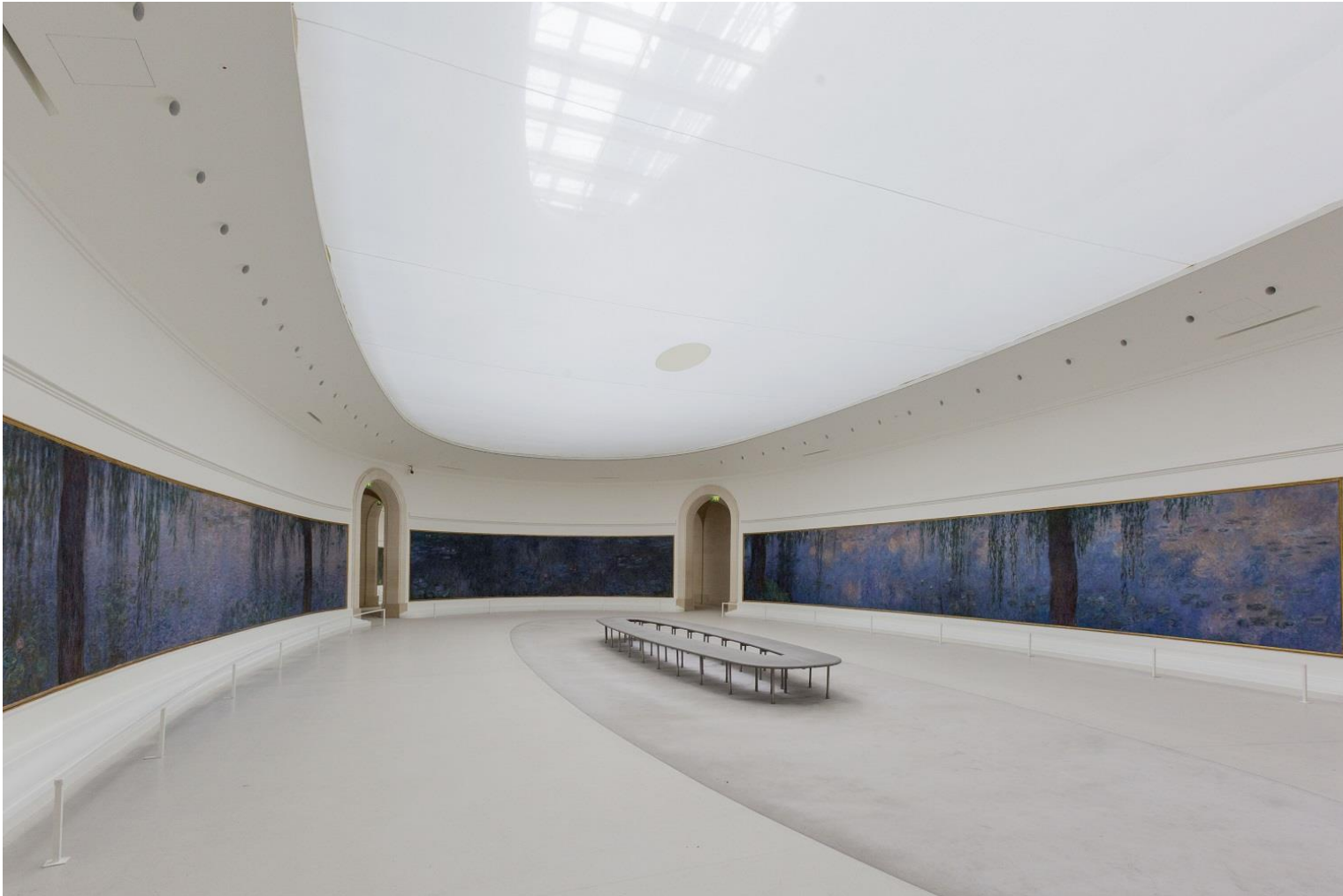
Claude MONET, Cycle des Nymphéas du musée de l'Orangerie , entre 1897 et 1926, huile sur toile, H : 1,97 m, L : environ 100 m linéaires, surface environ 200 m 2 . Musée de l'Orangerie, Paris, France.