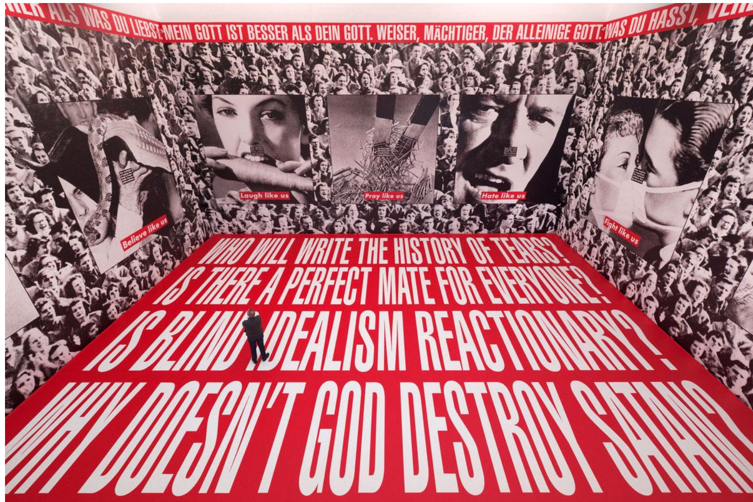
Barbara KRUGER, Untitled (Sans titre) , 1994-1995, dimensions variables, installation de sérigraphies photographiques sur papier. Museum Ludwig, collection Ludwig, Cologne, Allemagne.