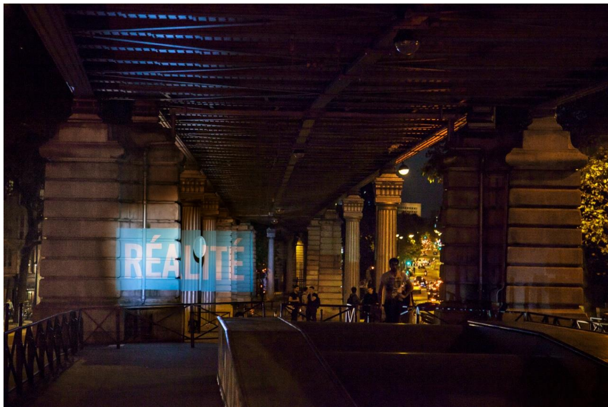
BOA MISTURA (collectif d'artistes), Réalité , 2014, installation, exposition La Nuit Blanche , sous le viaduc du métro parisien entre les stations Quai de la Gare et Chevaleret (ligne 6), environ 130 m linéaires, peinture à base d'eau. Paris, France.