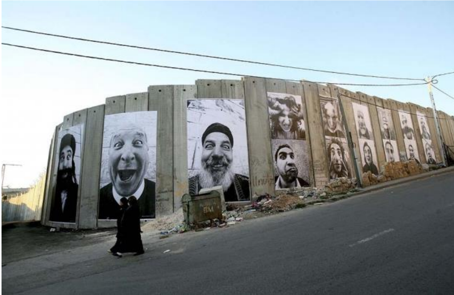
JR et MARCO, Face2Face , 2007, dimensions variables, mur de séparation israélo-palestinien. Ville de Bethléem, côté palestinien, Gaza, Palestine.