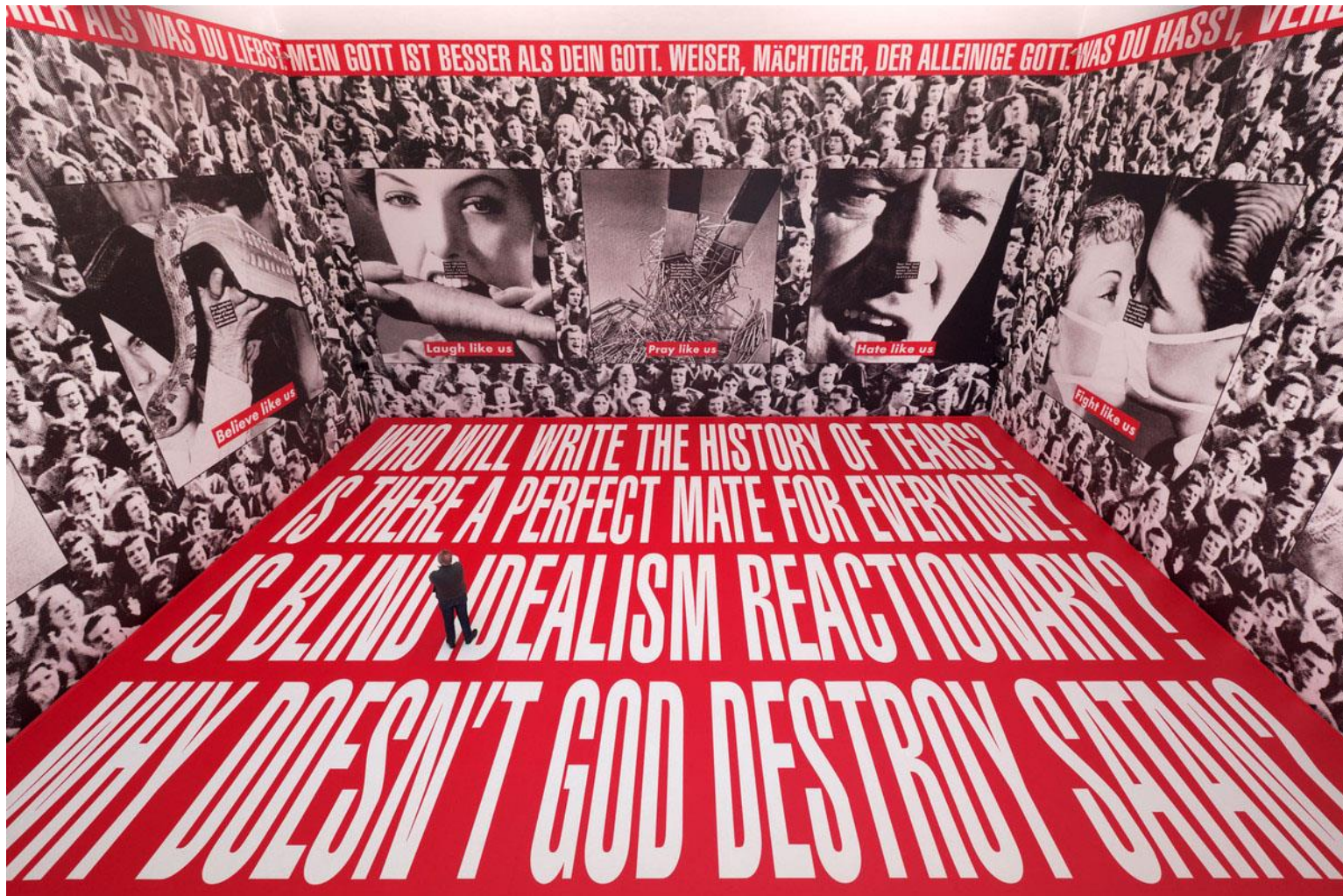
Barbara KRUGER, Untitled (Sans titre) , 1994-1995, dimensions variables, installation de sérigraphies photographiques sur papier. Museum Ludwig, collection Ludwig, Cologne, Allemagne.