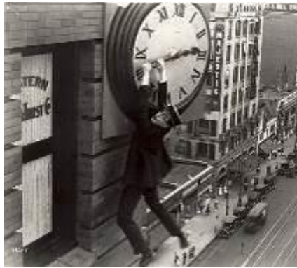
Monte là-dessus ! film avec Harold Lloyd, 1923