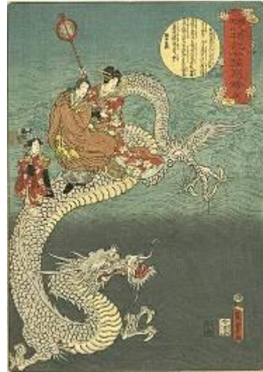
Estampe d'Utagawa Kunisada, XXème siècle.