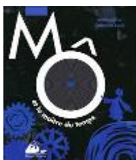
Mô et le Maître du temps , Marie Sellier, Catherine Louis, Picquier jeunesse, 2013, Album