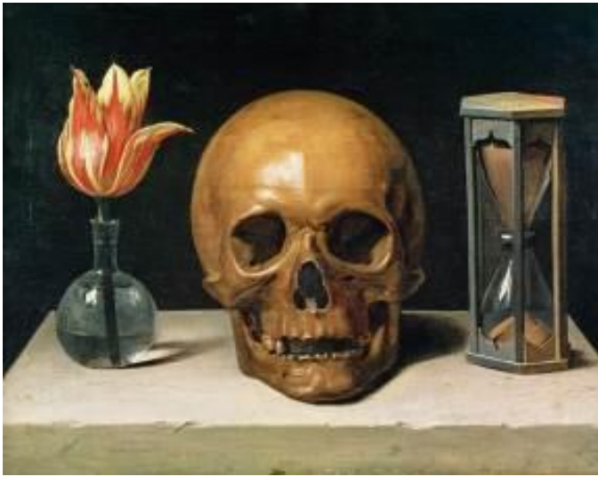
Vanité Philippe de CHAMPAIGNE XVII e siècle, Musée de Tessé - Le Mans.