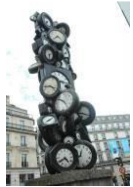
Les horloges Arman, XXème siècle.