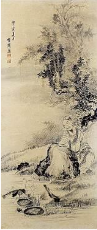
Le philosophe Zhou Dunyi Shū Moshuku Ai Ren Zu, 1794.

Le kakemono (littéralement « objet accroché »), ou kakejiku, désigne en Asie une peinture ou une calligraphie sur soie ou sur papier encadrée en rouleau et destinée à être accrochée au mur.