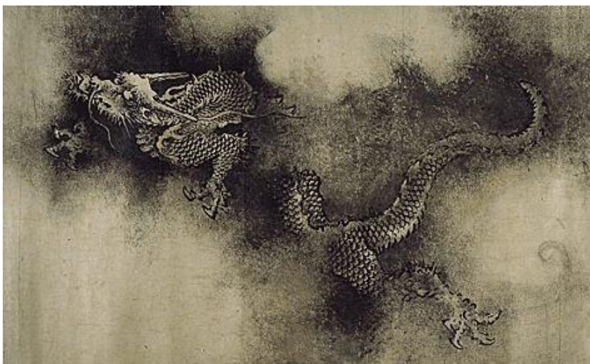
Dragon Noir dans les nuées - Chen Jung, XIIème siècle Tableau du paravent des Neuf Dragons.