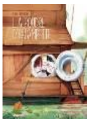
La poudre d'escampette , Chloé Cruchaudet, Delcourt, 2015, Bande dessinée