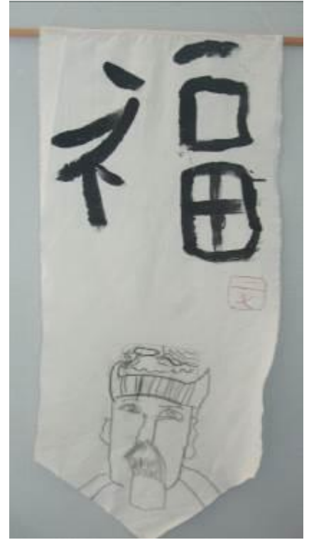
Réalisation d'élèves de CP école J. Ferry, Le Mans.

La conception d'un kakejiku artisanal est très exigeante et n'est confiée qu'à des spécialistes.