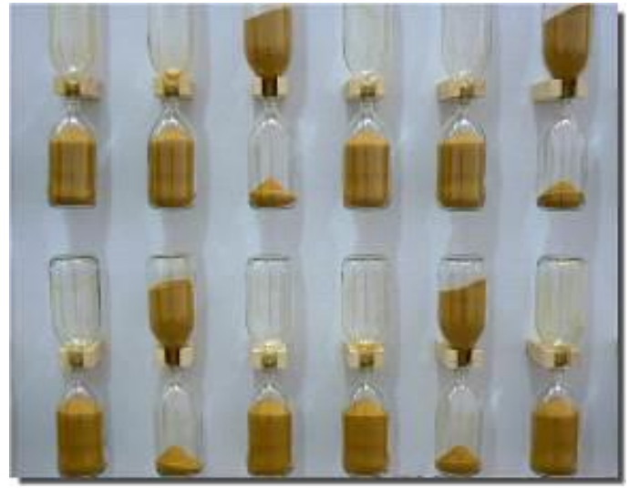
S'oublier dans le temps Rodrigue Glombard

Installation composée de quarante-huit sabliers suspendus où le temps n'en finit pas de s'écouler.