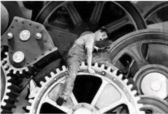
Les Temps Modernes film de Charlie Chaplin, 1936.

Pages 17 et 18 - Apparition du gardien des secondes. Cf. références culturelles ci-dessous :