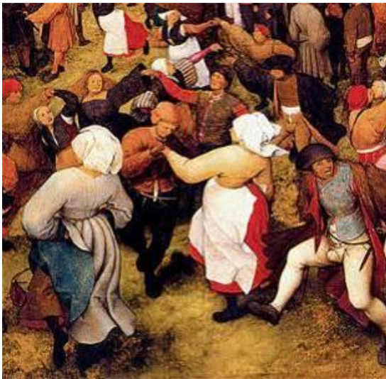
La Danse de la mariée, (détail) Pieter Bruegel, 1566

Cf. scènes de fête de village dans la peinture classique :