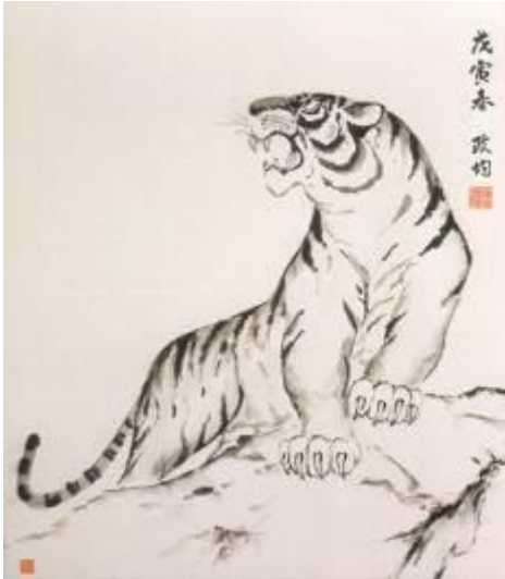
Anonyme, XIXème siècle.