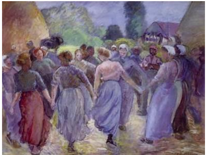
La Ronde Camille Pissarro, 1892

Pages 29 et 30 - Un gros plan en contre-plongée et une vignette à gauche, pour mettre en avant l'opposition des attitudes (solitude/foule, abattement/liesse, épuisement/joye) et donc le désappointement de Zhou Chu.