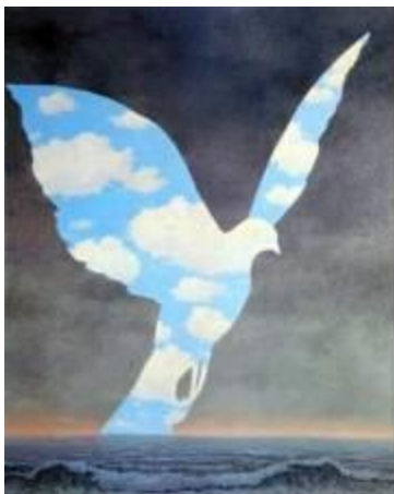
La grande famille - R. Magritte, 1963

Pages 23 et 24 - Le Maître du Temps (silhouette du traditionnel sage chinois) entouré de nuages en forme d'oiseau. Cf. tableaux de R. Magritte :