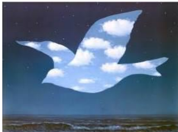
La promesse - R. Magritte, 1950

Pages 29 et 30 - Dame Mémoire nous précise que le grand trou noir est celui de l'oubli !