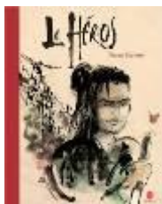
Le héros , Pierre Cornuel, HongFei, 2015, Album