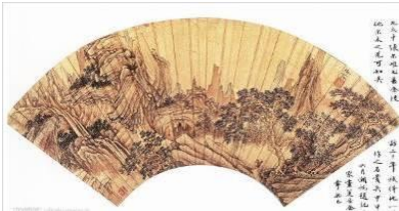
Eventail chinois - Anonyme, XIX ème siècle.

Le principe est de donner un débit d'air sur la peau, ce qui augmente le taux d'évaporation des gouttelettes de sueur. Cette évaporation induit un effet de refroidissement dû à la chaleur latente d'évaporation de l'eau. Leur usage est attesté dès l'Antiquité. Ils sont aussi utilisés aujourd'hui différemment, comme dans la danse, la publicité, la mode, etc.