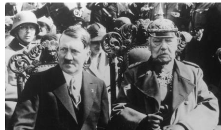
Hitler devient chancelier :