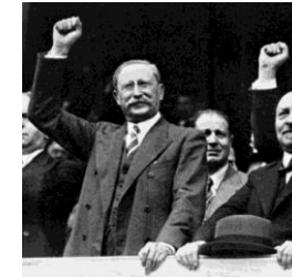
Victoire du Front populaire :