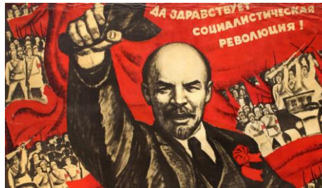
Révolution russe :