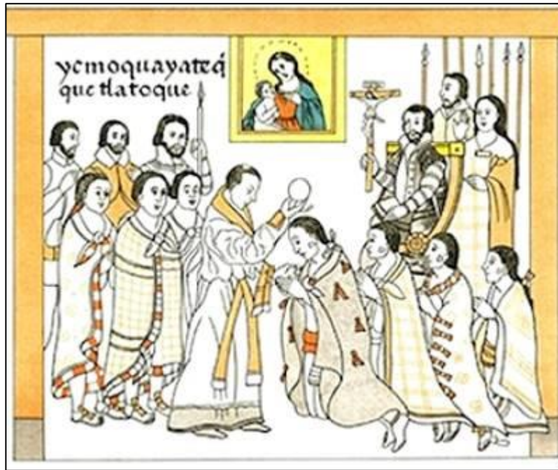
Codex « Lienzo de Tlaxcala », XVI e , BNF, Paris

Etape 1 En groupe, répondez aux questions sur votre cahier.