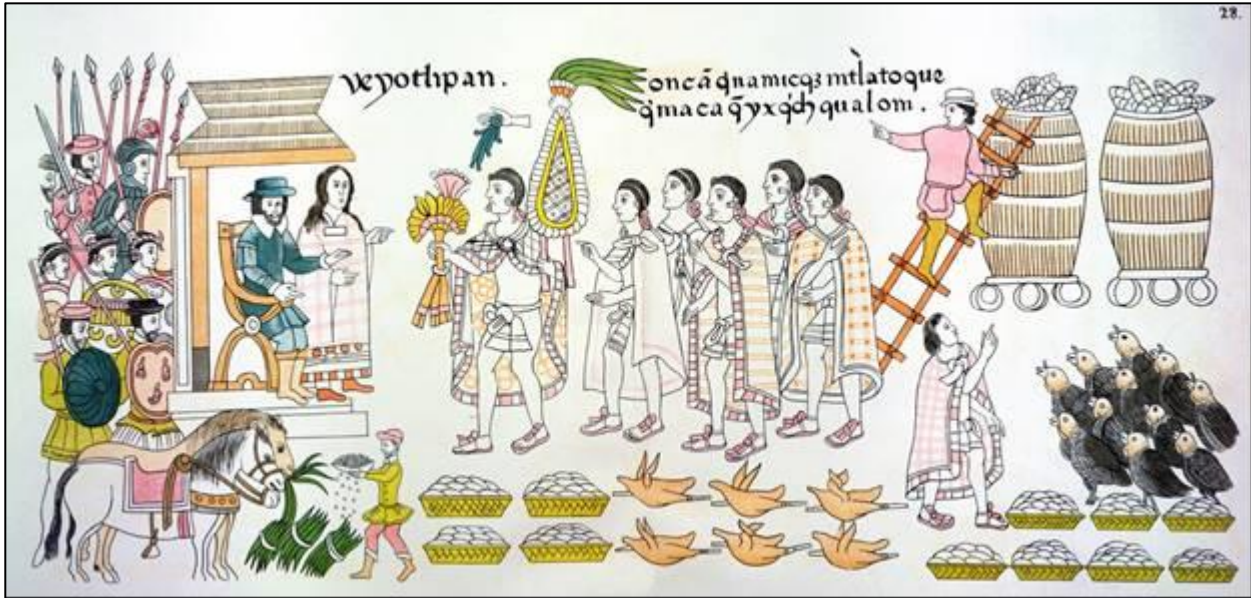
Codex « Lienzo de Tlaxcala », XVI e , BNF, Paris

Etape 1 En groupe, répondez aux questions sur votre cahier.