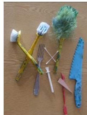
Variétés des outils... richesse des effets plastiques !

Dans le cadre d'un PEAC, on pourra associer cette étude d'œuvres et cette pratique plastique au domaine des arts du son, avec l'étude d'un poème sur ce thème :