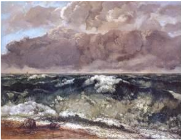
Mer orageuse (la vague) - Gustave Courbet, 1869