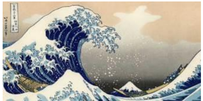
La Grande Vague de Kanagawa Katsushika Hokusai, 1830