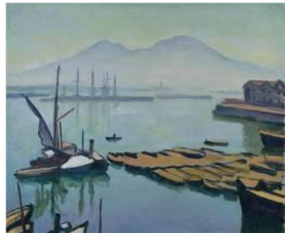
Baie de Naples - Albert Marquet, 1908