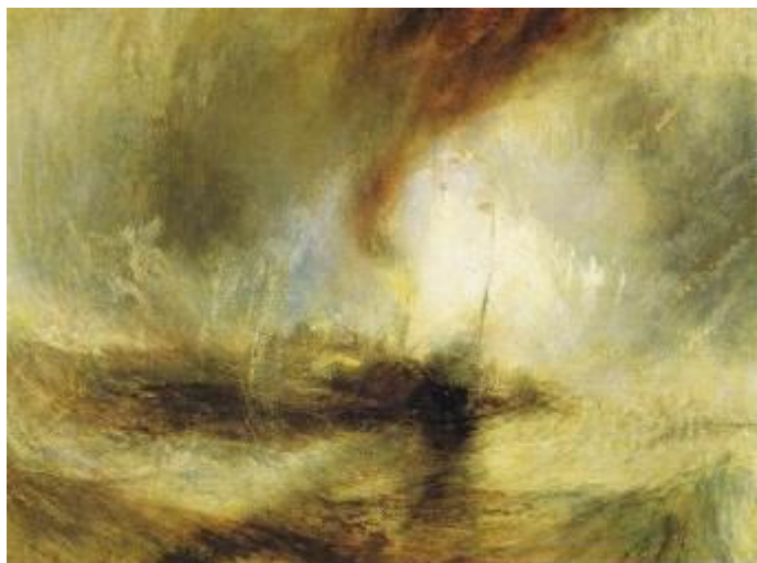
Vapeur dans une tempête de neige - W.Turner, 1842