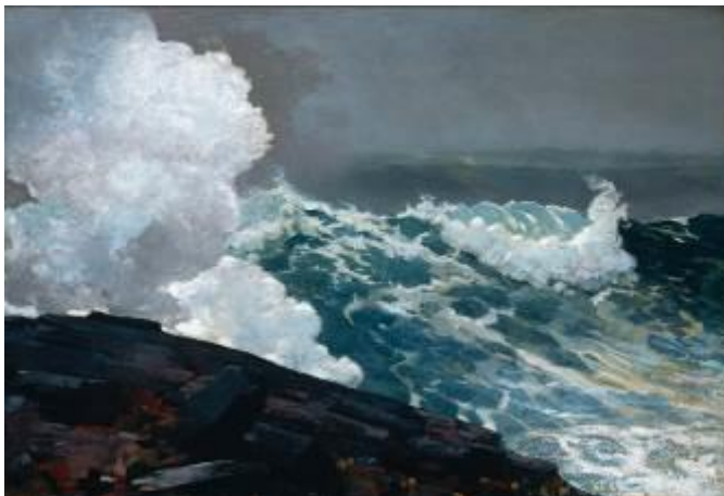
Northeaster - Winslow Homer, 1895