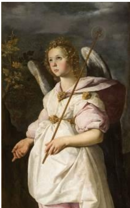
Saint Gabriel Francisco de Zurbarán, vers 1634