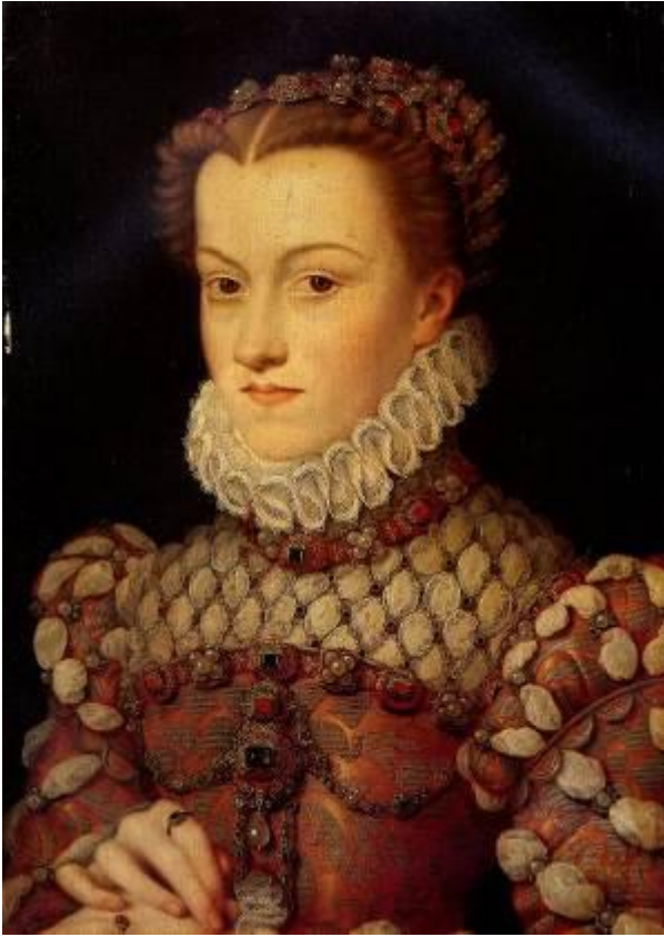
Elisabeth d'Autriche François Clouet, vers 1571.

Élisabeth d'Autriche (1554 - 1592) est devenue reine de France par son mariage avec Charles IX de 1571 à 1574. Membre de la maison d'Habsbourg d'Autriche, elle était la fille de l'empereur Maximilien II et de Marie d'Autriche.