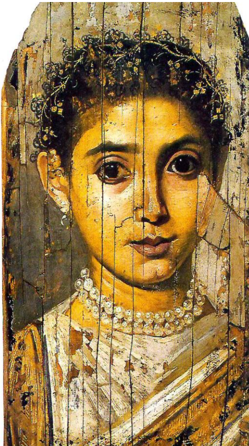
Portrait de jeune fille Fayoum, 3 ème siècle après JC.

Présenter l'objet dans un couvercle de boîte à chaussures sur lequel on aura collé un papier coloré. Intercaler un petit carré de carton entre le métal et le fond pour donner du relief.