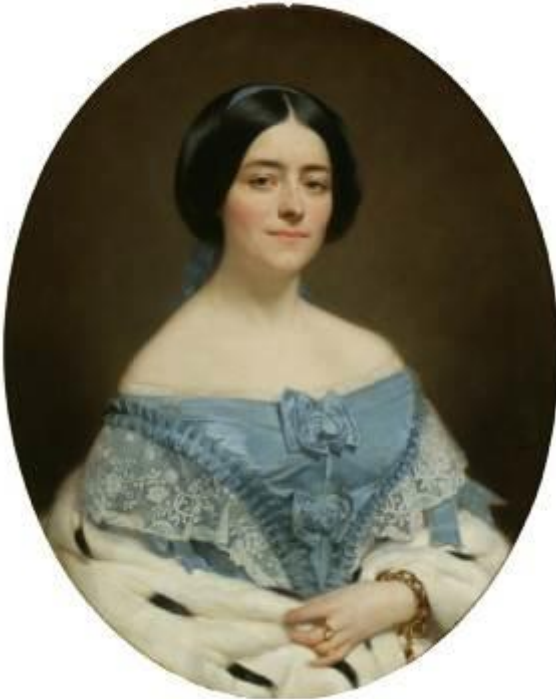
Comtesse de St Patern - J-B. Tissier, 1876 Musée de Tessé, Le Mans.

Au Moyen Âge et à la Renaissance, les bijoux sont la plupart du temps ornés de sujets religieux, qu'il s'agisse de pièces en émail peint ou de bijoux utilisant les formes fantaisistes des perles baroques,