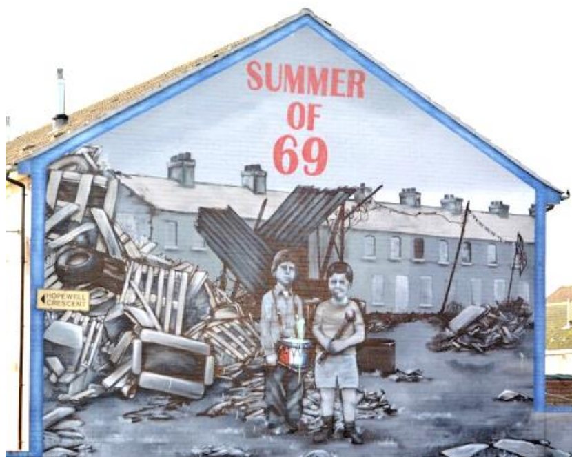
Mural sur Hopewell avenue, Belfast.

Peintures monumentales faites sur des murs qui en Irlande du Nord sont un moyen d'expression privilégié pour les catholiques comme pour les protestants. Elles permettent à ces communautés d'identifier leur territoire.