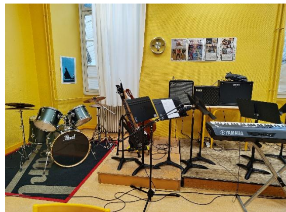
Un équipement riche

Des projets interdisciplinaires associent musique, arts plastiques et littérature. Les élèves participent également à des sorties culturelles ciblées (concerts spécialisés, voyages à Paris) et à un voyage en Finlande autour du thème « musique et voyage ».