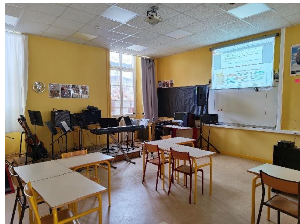
Salle de musique du lycée

La chapelle du lycée, équipée d'un piano quart de queue, accueille ponctuellement répétitions de chorale, concerts et projets spécifiques. Son accès reste limité et réservé principalement aux élèves du cycle terminal.