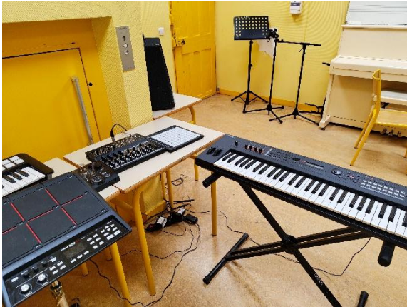
Studio de travail

Le recrutement des élèves candidats en enseignement de spécialité musique s'effectue sans critère autre que la motivation à faire de la musique, avec le souhait de pouvoir accueillir tous les profils musicaux. Les journées portes ouvertes, organisées début mars, constituent un temps fort pour prendre des informations et se décider.