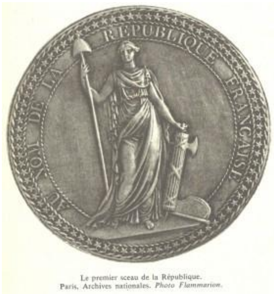
Le premier sceau de la République. Paris, Archives nationales.

Cette étude peut donner lieu à des séances d'AP :