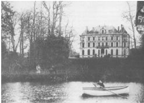
Le château a été détruit en 1944. Il ne reste plus aujourd'hui que la grille.