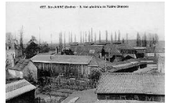
Coll. Photo Club Ste Jamme – Fin XIX e