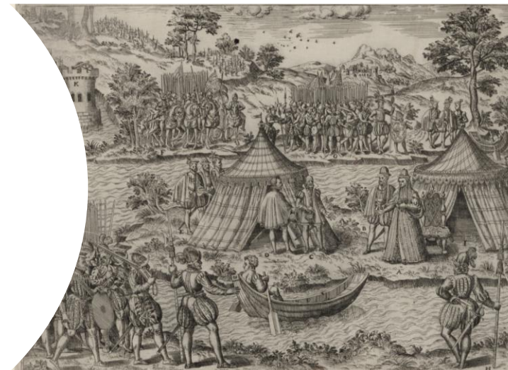
Credit photo : la paix faite à l'île au brucis, le 13 mars 1360, Gallica B.N.F.