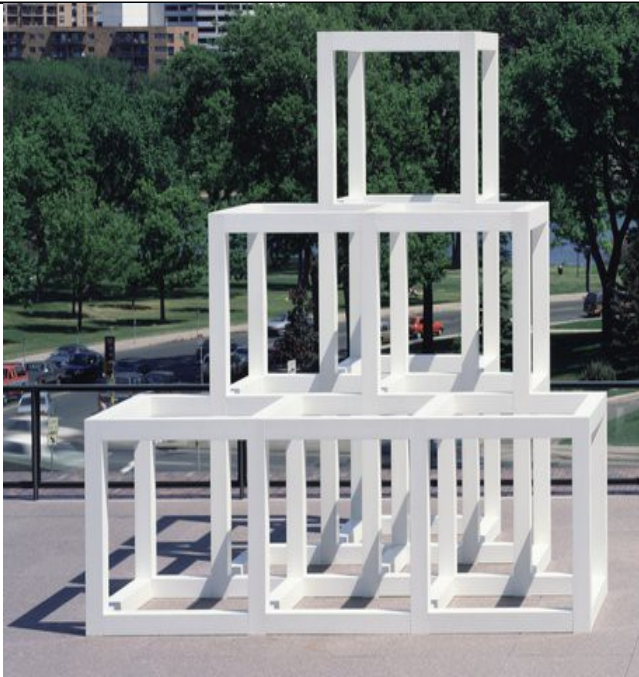
Sol Lewitt : 'Three X four X three' 1984 Minéapolis