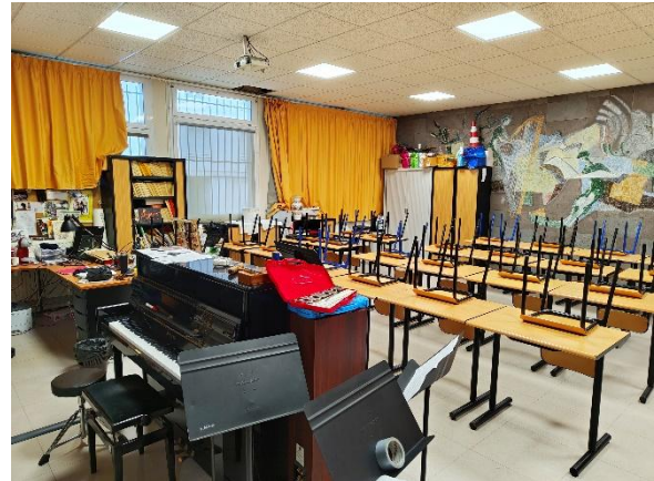
Salle de musique du lycée

Le parc de matériel est conséquent : sonorisation, instruments acoustiques et amplifiés, numériques, microphones et équipements divers permettant de développer des pratiques variées, aussi bien pour le travail collectif que pour les travaux pratiques en effectifs réduits.