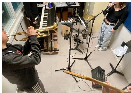
Travail collectif en studio

La chorale et la fanfare sont régulièrement amenées à travailler ensemble, notamment dans le cadre des concerts « Salade » des Irréductibles , où l'ensemble des élèves est réuni à différents moments du programme. Pour l'année 2025–2026, l'enseignement de musique est engagé dans de nombreux projets :