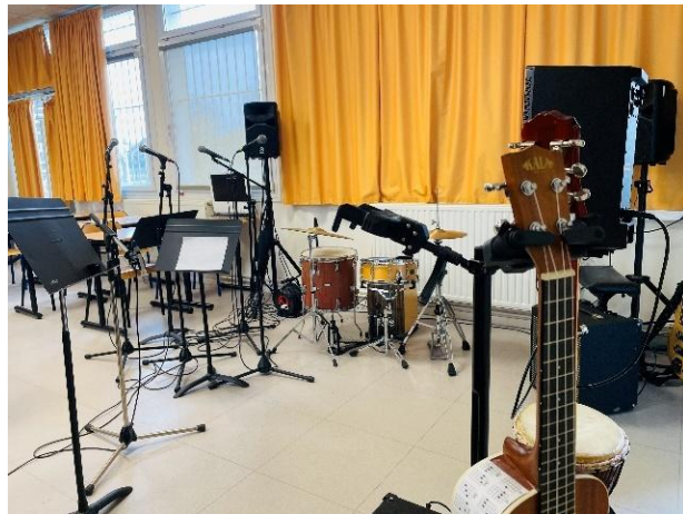
Grande salle de répétition

A titre d'exemple la promotion 2024-2025 est aujourd'hui en : BTS, université(droit, géographie-aménagement, STAPS, LEA, musique, philosophie...), écoles de cinéma, classes préparatoires artistiques et en conservatoire.