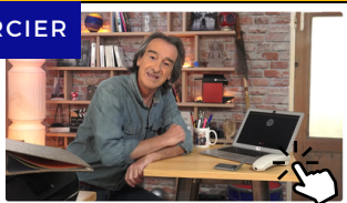
Le Secours orange #Prévention des risques professionnels