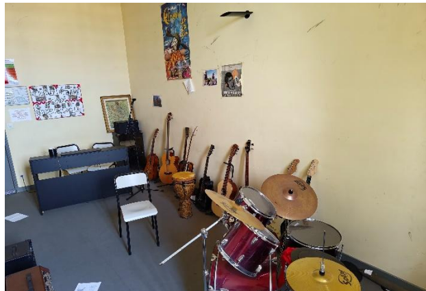
Salle de répétition / studio