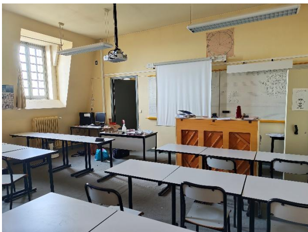
Salle d'enseignement de musique

Un travail spécifique est également mené sur la préparation du Grand oral, dans une logique de réflexion personnalisée.