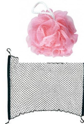
Grillage ou fleur de douche coupée