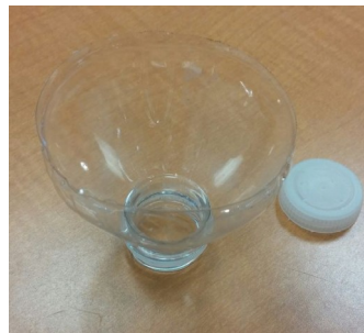
Entonnoir (haut de la bouteille coupée)