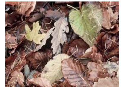
Litière du sol