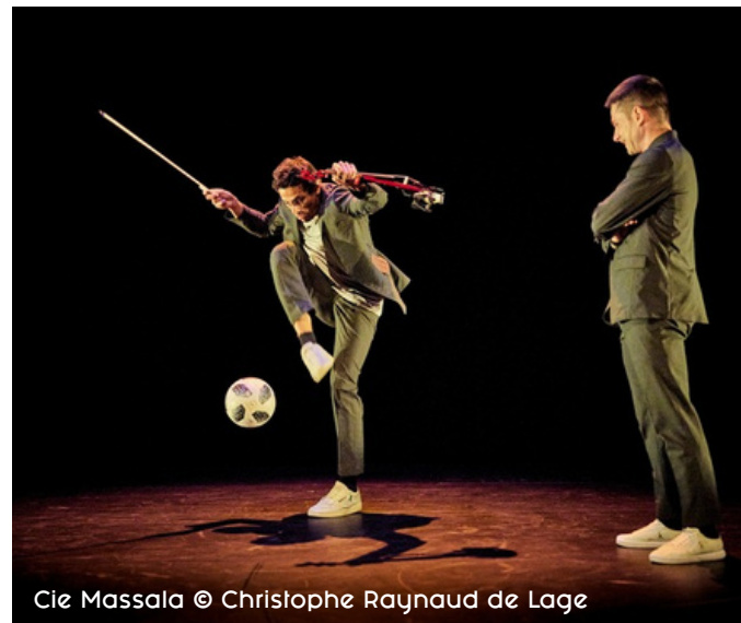
Cie Massala

"oUp" création 2025 de la Cie Le Phare - Centre chorégraphique national du Havre Normandie / direction Fouad Boussouf