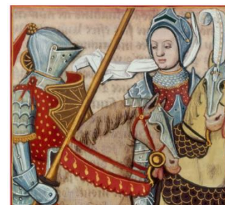
Jeanne de Belleville, « la Dame de Clisson » (1300-1359)