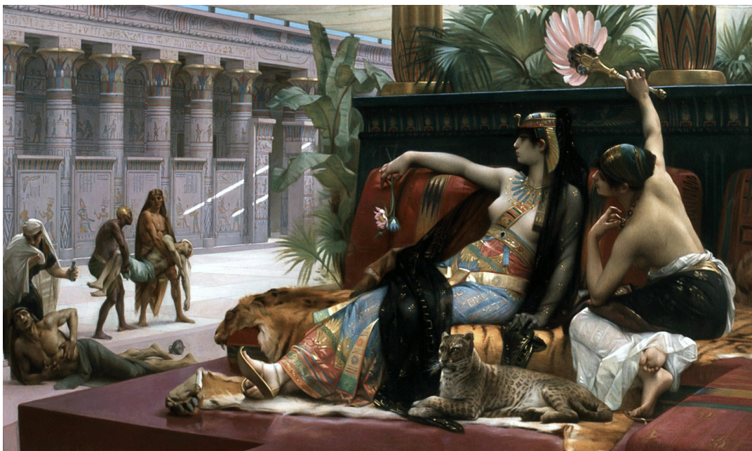
Cléopâtre essayant des poisons sur des condamnés à mort, Alexandre Cabanel, 1887, musée royal des Beaux-Arts, Anvers

➤ Quelle image de la reine d'Égypte et de son pays ce tableau donne-t-il ? Justifiez votre réponse.