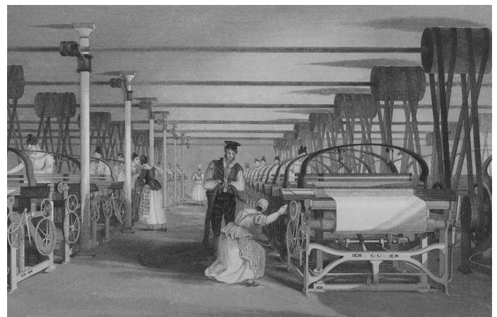
Métiers à tisser dans une usine textile, 1835