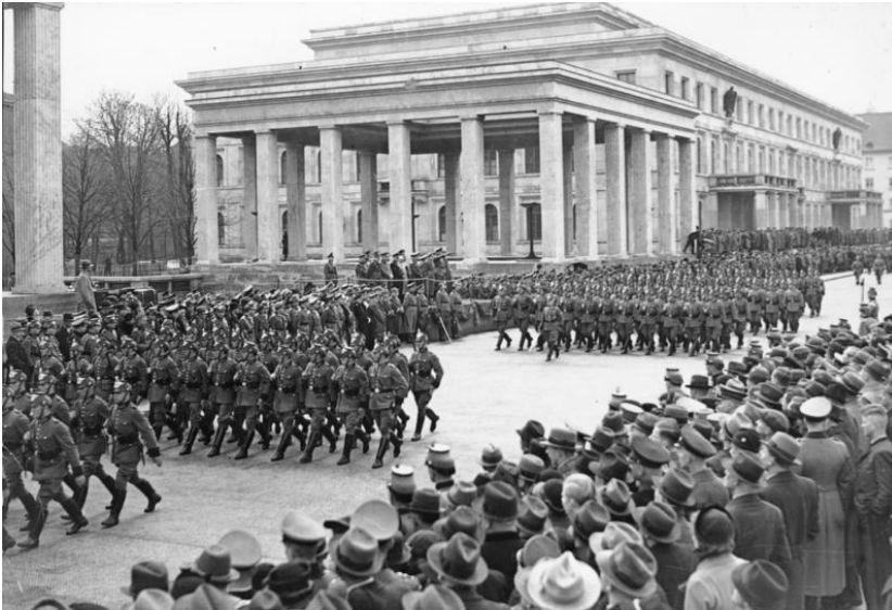
124. April 1938