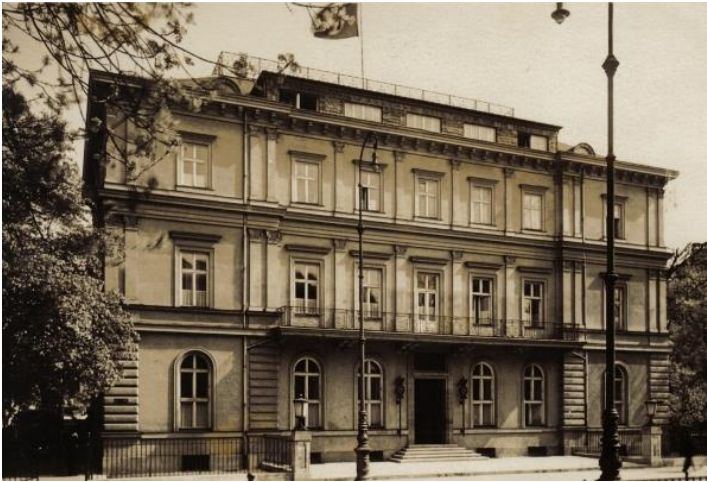
La maison brune en 1935

En 1930, le NSDAP a acheté le bâtiment et l'architecte Paul Ludwig Troost l'a largement reconstruit. En 1931, le parti quitta un bâtiment situé à l'arrière de la Schellingstrasse pour y établir son siège. Après la prise du pouvoir par les nationalistes socialistes en 1933, des opposants politiques furent emprisonnés et torturés dans le sous-sol de la "Maison brune". Dans son voisinage, un district administratif tentaculaire avec les autorités centrales et les antennes du parti se forma.