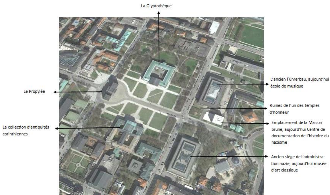
Document 2 : Vue aérienne de la place (2018 Google Earth)

Accéder à l'image interactive : https://view.genial.ly/5c290626a4eaa03097ced672/konigsplatz