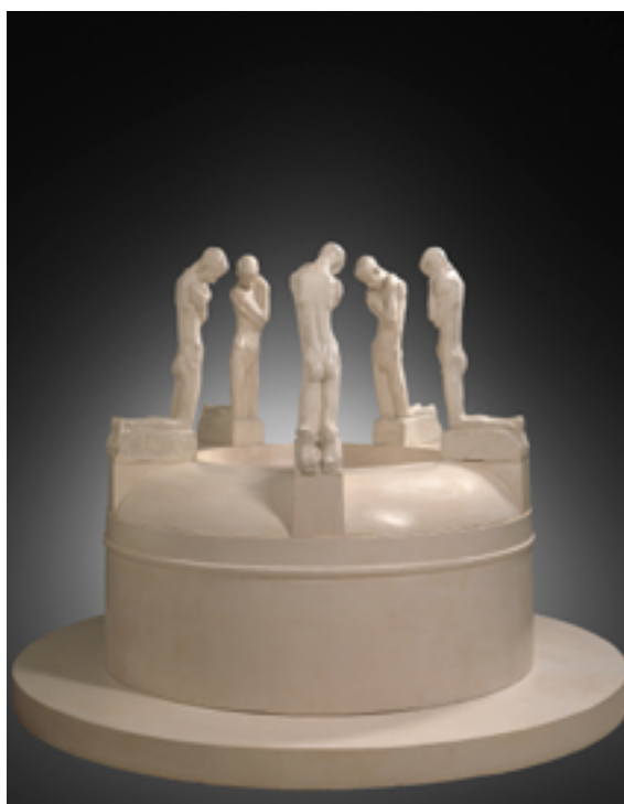
George Minne, La Fontaine aux agenouillés, 1927, groupe en plâtre, 168 x 240 cm, Gand, Museum voor Schone Kunsten.

que de créer de nouveaux sujets. Son mode de réalisation devient conceptuel et symboliste, par des changements de points de vue, d'échelle et de matériaux. De nombreux fragments ont mené une vie autonome notamment ceux issus de La Porte de l'Enfer .