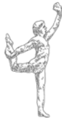
L · Mouvement de danse E , 1911, statuette en plâtre enduite d'un agent démoulant, entre 1952 et 1957, 37,3 x 18,5 x 7,1 cm, Paris, musée Rodin. Fasciné par les danseuses et le mouvement, Rodin pose ici l'équilibre du corps grâce à la main dressée en avant, vers le haut.