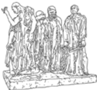
A • Monument des Bourgeois de Calais , 1889, groupe en plâtre, épreuve récente réalisée par la Fonderie de Coubertin, 2005, 231 x 248 x 200 cm, Paris, musée Rodin.

Pour Rodin, les mains sont l'emblème de la vie. Traitées de façon autonome, il les étudiait et les modelait sans cesse pour trouver le mouvement juste. Tout au long de ce parcours, la simple observation des mains modelées dans l'oeuvre de ce sculpteur et chez d'autres artistes permet de comprendre leurs significations particulières, révélatrices des sentiments les plus intenses.