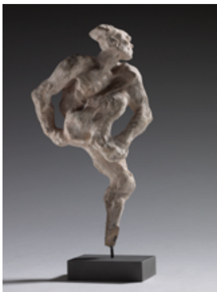
Nijinski, 1912, statuette en plâtre, vers 1953, 17,5 x 10 x 6 cm, Paris, musée Rodin.

Bien plus tard, le sculpteur français d'origine russe, Ossip Zadkine (1890-1967) a suivi cette réflexion rodinienne dans le Torse de la ville détruite (1953), une commande passée par la ville de Rotterdam en hommage aux victimes de la Seconde Guerre mondiale. Choqué en découvrant la ville bombardée en mai 1940, il ressent la violence et la retranscrit avec un style expressionniste, sans abandonner l'idée d'espérance. Le corps énergique se contorsionne de douleur et se désarticule en lignes brisées. Toute la force réside dans ce buste puissant, vidé de son cœur, mais prêt à se reconstruire. La tête est déformée par un cri d'horreur.