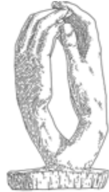
I · La Cathédrale , 1908, assemblage de deux mains droites en pierre, 64 x 29,5 x 31,8 cm, Paris, musée Rodin. Traiter les deux mains comme une partie architecturale est une proposition très moderne. Elles forment une voûte gothique sous laquelle l'homme aspire à la protection et à l'amour.