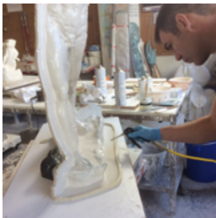
Passage d'air comprimé pour chasser les bulles.

Ce moule ressemblera à une peau souple en deux parties. C'est pourquoi je dois faire une séparation avec un joint de plastiline, une pâte à modeler bien pratique pour le mouleur car elle ne sèche pas et ne risque donc pas de se rétracter. J'ai