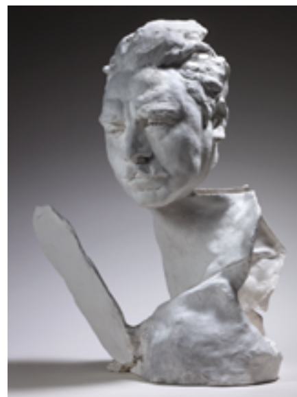
Henry Becque, tête sur cou de L'Ombre et panneau, après 1904, assemblage en plâtre, 70 x 46,5 x 47 cm, Paris, musée Rodin.

Rodin conservait aussi les fragments de corps en plâtre - les bras, les mains, les têtes - que l'on appelle des abattis et puisait dans ce stock pour élaborer ses assemblages. Les abattis sont un peu comme des « mots » et les œuvres de Rodin, qui les combinent, des « phrases ». C'est un art de la composition et de la décomposition puis de la recomposition traité à l'infini. De plus, les traces laissées par les outils, les accidents et les coutures du moule témoignent du processus créatif. L'effigie étrange née d'un buste d'Henry Becque rend compte de cette pratique franchement moderne !