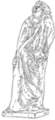
G · Balzac , 1898, figure monumentale en plâtre, 275 x 121 x 132 cm, Paris, musée d'Orsay, dépôt du musée Rodin, 1986. Un écrivain représenté sans montrer la main qui écrit est un défi ! C'est la tête du génie littéraire qui joue le premier rôle.