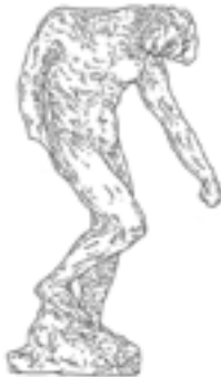
K · Grande Ombre , 1904, statue en bronze, grand modèle sans main, fonte au sable par Alexis Rudier, 1904, 194 x 110 x 60 cm, Lyon, musée des Beaux-Arts. La figure damnée provenant de La Porte de l'Enfer est amputée de ses deux mains. Ce choix de représentation signale l'incapacité à agir dans le monde infernal.