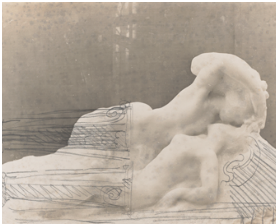
Eugène Druet, Jeune Fille embrassée par un fantôme , retouchée à la plume et encre brune, épreuve gélatino-argentique, Paris, musée Rodin.

C'est surtout après le Monument à Balzac que Rodin devient attentif à la diffusion de son œuvre, lors de l'exposition organisée en 1896 à Genève. Durant cette manifestation, les photos reproduisaient les œuvres absentes. Rodin avait surtout l'habitude de griffonner au dos à la mine de plomb, puis il retraçait les contours de sa sculpture à la pointe et retouchait le cliché pour corriger un mouvement ou un piédestal, gardant ainsi en mémoire des modifications pour de futures réalisations. Parmi les changements opérés par la photographie sur la sculpture, Jeune fille embrassée par un fantôme en marbre (après 1900) comporte des retouches au crayon. Il réinterpréta sa propre sculpture en choisissant d'en faire un groupe vertical, transformé en cariatides, supportées par des gaines imaginées par le dessin.