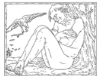
F • Charles René de Saint-Marceaux, L'Hiver (Vieillesse) , 1897, plaquette en cuivre, 20,4 x 25 cm, Paris, musée d'Orsay.

Tendues vers le ciel, encore pleines d'espoir, les mains sont l'expression même de la supplication.