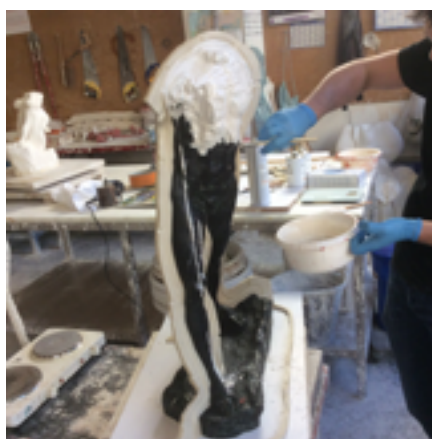
Moule en élastomère de silicone.

atelier : un silicone polycondensation, qui s'applique au pinceau par couches successives notamment sur les marbres de Versailles, que nous aidons à préserver depuis 2008 et le silicone polyaddition qui, une fois débullé (les bulles d'air sont enlevées par une pompe à vide), s'utilise en coulée (plus stable et moins de retrait). Aux résines, qui ont été une révolution dans le moulage il y a une quarantaine d'années, succède aujourd'hui comme nouvelle technique la numérisation 3D, avec une prise d'empreinte par scanner.