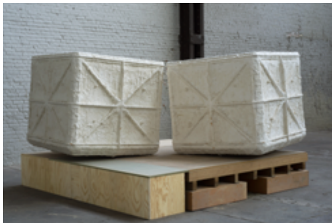
Didier Vermeiren, Cariatide à l'urne et Cariatide à la pierre , 1997, plâtre et bois 167 x 260 x 260 cm, Collection de l'artiste.

La démarche du sculpteur et photographe belge Didier Vermeiren (né en 1951) va plus loin encore. Le socle devient le sujet même de l'œuvre comme appartenant au domaine de la création. La statue est un ensemble « nature-socle » selon le créateur.