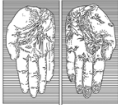
H · Annette Messenger, Les Mains , série Mes Trophées , 1987, diptyque, fusain et aquarelle sur photographie noir et blanc, 191 x 110 cm, chaque épreuve, Paris-La Défense, Centre national des Arts plastiques. Comme Rodin, Annette Messenger dessine sur ses photographies. Par ses décors merveilleux, elle expose la main comme un fragment portant l'histoire intime de chaque être humain.