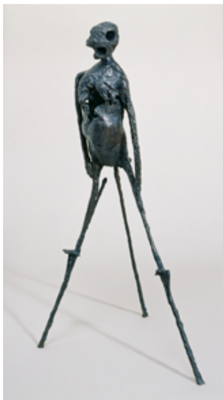
Germaine Richier, Le Berger des Landes, 1951, statue en bronze à patine brune, 149 x 89 x 60 cm, Indivision Germaine Richier.

Plus tard encore, la sculptrice Germaine Richier (1902-1959) compose un univers très particulier en hybridant matières et objets. Attachée à la représentation du corps humain, elle l'associe à un élément naturel à un objet usé par le temps, puis donne vie à de nouvelles figures. Le Berger des Landes est une forme masculine posée sur deux échasses. La sculptrice trouva sur une plage de Normandie, un morceau de brique mêlé de ciment poli par la mer. Celui-ci, devenu la tête fut installé sur le corps, de biais.