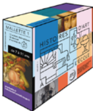
© Lysiane Bollenbach et Clément Vuillier

http://www.grandpalais.fr/fr/les-mallettes-pedagogiques