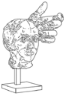
J · Masque de Camille Claudel et main gauche de Pierre de Wissant , vers 1895 ?, assemblage en plâtre, 32,1 x 26,5 x 27,7 cm, Paris, musée Rodin. La combinaison du portrait de l'artiste Camille Claudel et de la main d'un des Bourgeois de Calais est très énigmatique. Cette main souligne la beauté du visage. Peut-être est-ce celle du créateur ?