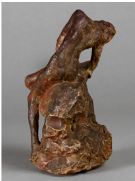
Femme nue assise sur un rocher, vers 1900, statuette en terre cuite 20,5 x 10 x 8 cm, Lyon, musée des Beaux-Arts.

Le Pêcheur de palourdes est la première grande création modelée directement à la main, traitée avec des effets de matière triturée comme Rodin. D'autres artistes plus contemporains, présents dans l'exposition, partagent cette approche matérialiste. C'est le cas de l'artiste chinois Sui Djianguo (né en 1956), qui va jusqu'à frapper avec ses pieds et ses mains la matière. Pour son œuvre Blind portrait (2012), il combat l'argile et travaille sur les effets du hasard. Il joue de la perte de contrôle pour aboutir à un résultat à la charnière entre figuration et abstraction.