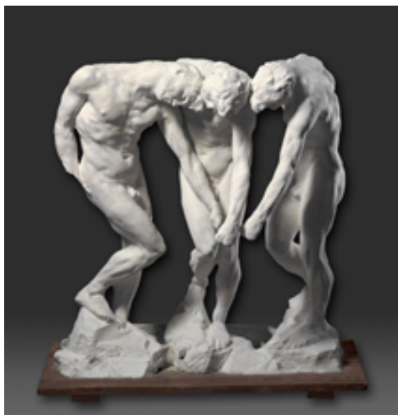
Les Trois Ombres, avant 1886, assemblage en plâtre sur plateau en bois, 97 x 92 x 40 cm, Paris, Centre national des arts plastiques, en dépôt au musée des Beaux-Arts de Quimper.

Rodin conservait aussi les fragments de corps en plâtre - les bras, les mains, les têtes - que l'on appelle des abattis et puisait dans ce stock pour élaborer ses assemblages. Les abattis sont un peu comme des « mots » et les œuvres de Rodin, qui les combinent, des « phrases ». C'est un art de la composition et de la décomposition puis de la recomposition traité à l'infini. De plus, les traces laissées par les outils, les accidents et les coutures du moule témoignent du processus créatif. L'effigie étrange née d'un buste d'Henry Becque rend compte de cette pratique franchement moderne !