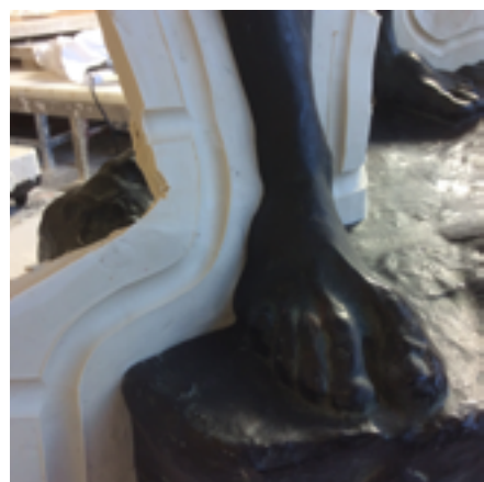
Joint de plastiline.

Parlez-nous de ce que vous faites en ce moment :