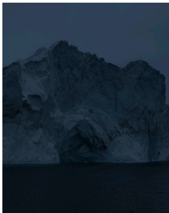
Juliette Agnel Porte IV , 2018 Tirage fine art mat papier Hahnemühle ultra smooth

Un stage de techniques photographiques encadré par un photographe professionnel.