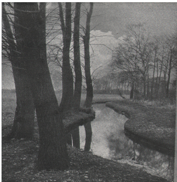
Otto Scharf Vorfrühling (Early Spring) , 1902 Tirage moderne

En imitant la peinture, la photographie affirme paradoxalement sa singularité. Les procédés de tirage, les interventions manuelles et les effets atmosphériques deviennent des moyens d'inscrire l'image photographique dans le champ des beaux-arts. Cette stratégie d'appropriation révèle une rivalité fondatrice : pour être reconnue, la photographie emprunte à la peinture ses formes et ses valeurs, tout en préparant les conditions de son émancipation progressive et de l'invention d'un langage propre.