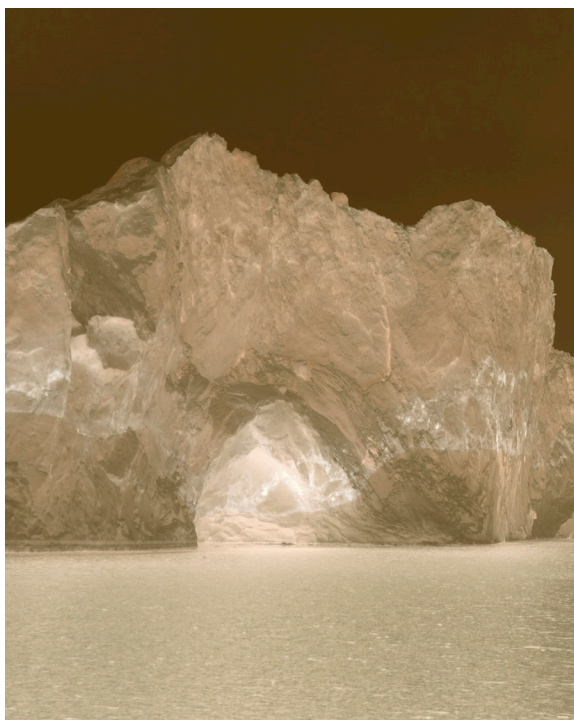
Juliette Agnel Porte III , 2018 Tirage fine art mat papier Hahnemühle ultra smooth

À destination des scolaires, de la maternelle au lycée : visites de l'exposition couplées à des ateliers pour aborder l'histoire de la photographie, les liens entre peinture et photographie, tester des procédés photosensibles et les techniques artistiques permettant de retravailler les photographies.