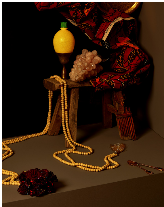
Maya Inès Touam, Désirs projetés , 2021 Tirage Fine Art sur papier

Ces œuvres ne se contentent pas d'imiter : elles réinterprètent les gestes et les styles picturaux à travers l'objectif, traduisant (ou travestissant) le langage propre de la peinture dans celui de la photographie. La couleur, le grain, le flou ou la netteté deviennent autant de pinceaux et de touches. Les photographes explorent la tension entre présence et représentation, abstraction et réalisme, créant des images à la fois familières et inédites. Dans chacune d'elles, on décèle à la cohabitation d'une tradition artistique et d'un regard contemporain.