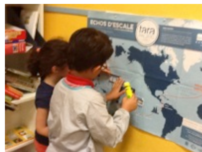
Retrouvez les ressources pédagogiques des 37 escales des missions de Tara et constituez votre propre parcours ! OUVREZ LA MALLE en cliquant sur l'un des trois ordres : Thématiques, Escales ou Expéditions. Téléchargez l'inventaire pdf de la malle en cliquant ici.

Nb : Les fiches ressources au fil des années ont été conçues par des enseignants pour des enseignants (dont l'académie de Rennes) coordonnées par un inspecteur pédagogique régional en charge de l'EDD.