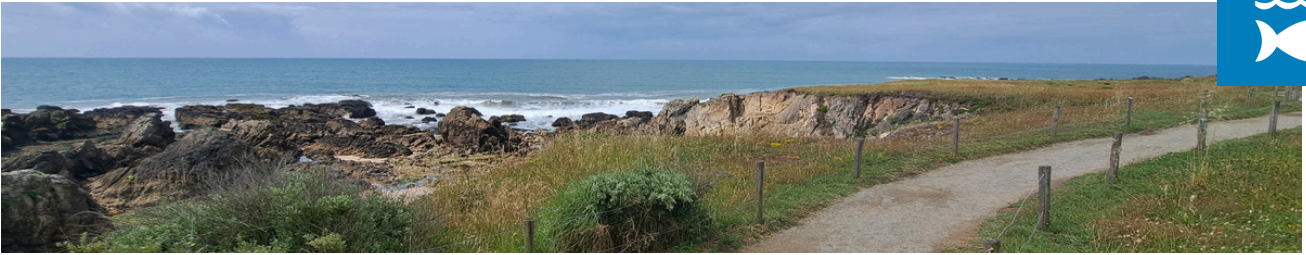
La côte sauvage, Loire-Atlantique, juin 2024.

L'annonce de cette thématique fut faite par Emmanuel Macron, le 8 juin 2023, lors de la journée mondiale des océans. En 2025, la France recevra la troisième Conférence des Nations Unies sur l'Océan. Voici quelques propositions de programmes d'activités avec les élèves et/ou les éco-délégués, du cycle 1 au lycée.