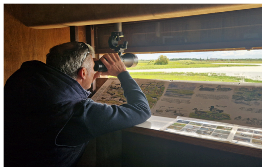
Observatoire de St-Denis-du-Payré, Vendée, Mai 2024.

➤➤ Inscription par le chef d'établissement.