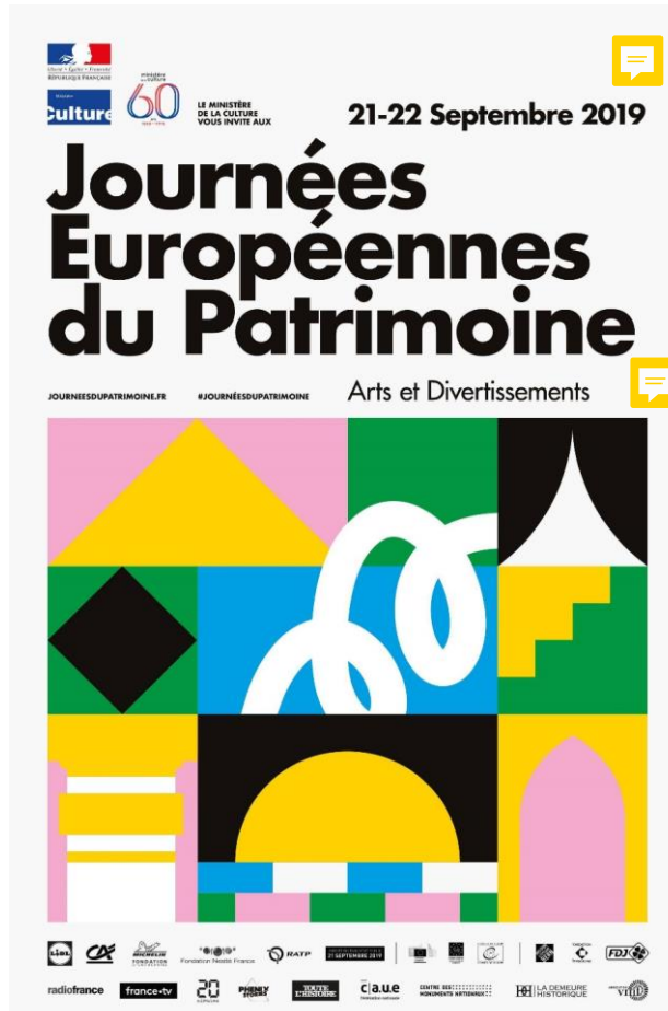
L'affiche de 2019 des journées européennes du patrimoine