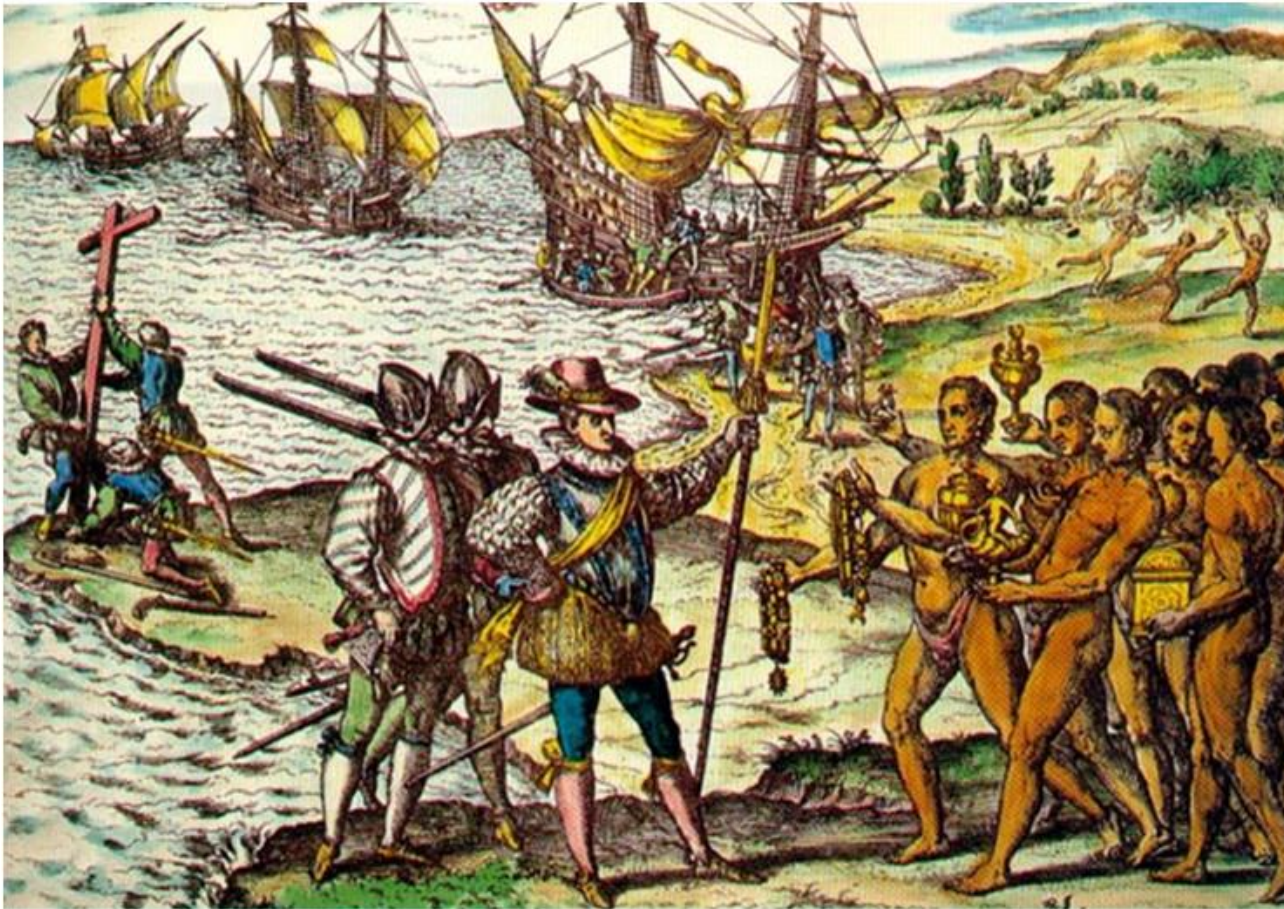
Colomb arrivant sur l'île d'Hispaniola Théodore de Bry — Americae Tertia Pars

1 – L'image de référence n'est pas projetée au début de la séance.