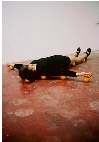
6 Erwin WURM, one minute sculpture , 1997 Photographies de performances éphémères.