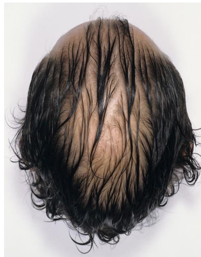
5 Patrick TOSANI, P.G. , 1992 Photographie sans retouche mais avec trucage