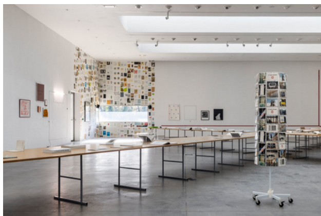
Vue de l'exposition X de Claude CLOSKY au FRAC des Pays de la Loire.

partir du format de chaque œuvre et de son numéro d'inventaire.