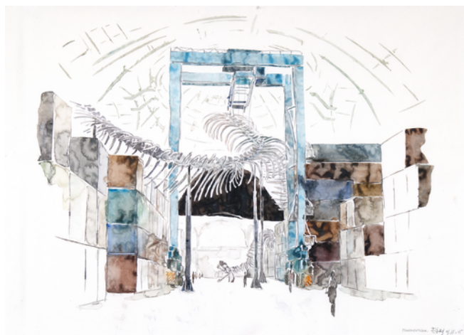
HUANG YONG PING, Dessin préparatoire pour Empires , 2015