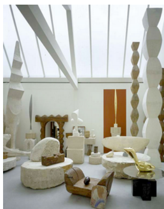
Renzo PIANO, Reconstitution de l'atelier Brancusi, 1997.

« Une exposition est avant tout un lieu pour exposer, plus qu'une idée à exposer »