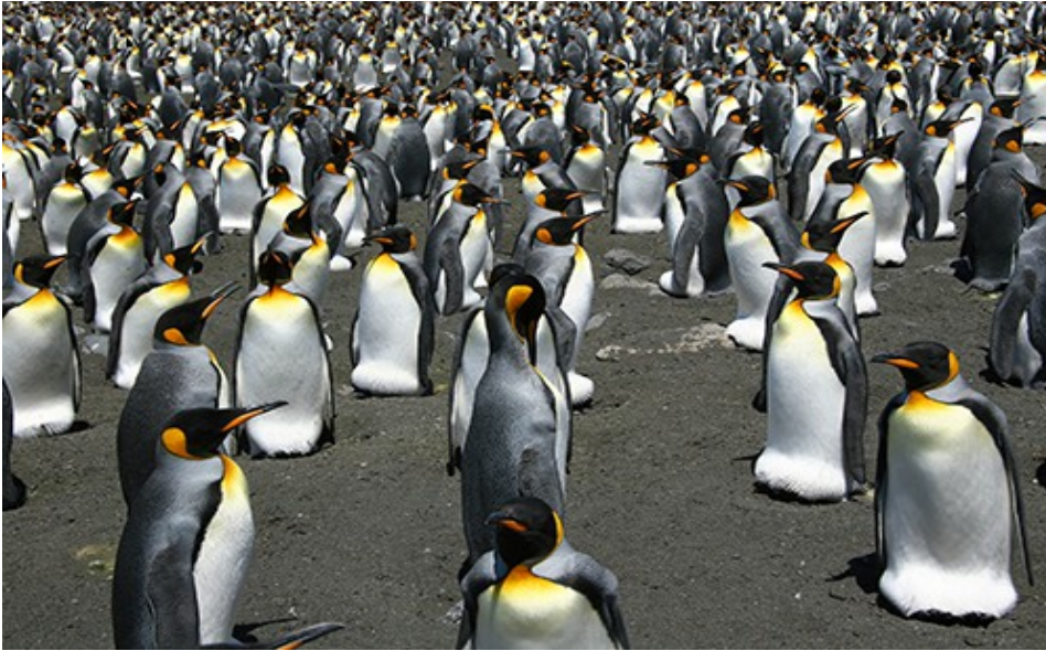
Colonie de manchots royaux de la Baie du Marin, Île de la Possession, Archipel de Crozet

Plus de 70% de la population mondiale de manchots royaux, qui nichent aujourd'hui sur les îles subantarctiques de Crozet, Kerguelen et Marion/Prince-Edouard, pourrait bien n'être plus qu'un souvenir avant la fin du siècle : les changements climatiques les forceront bientôt à s'exiler vers le Sud ou disparaître [...]