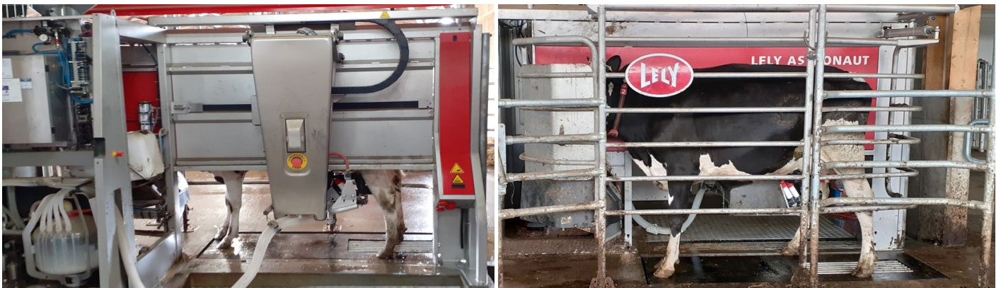
Doc 2 : La production laitière en France