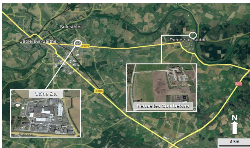
Doc 4 : Le système productif laitier sablois, très lié à la mondialisation.

Le robot de traite représente un investissement important, mais permet de rationaliser la production. Chaque vache dispose d'une puce et le robot détecte combien de litres de lait chaque vache produit.