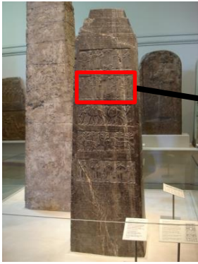
Obélisque noir de Salmanazar III, IX e siècle av. J.-C., British Museum, Londres