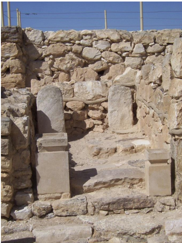
2. Pièce du temple de Tel Arad comportant deux autels à encens et deux stèles (pierres plates dressées) représentant le dieu Yahvé et la déesse Astarté, VIII e siècle av. J.-C.