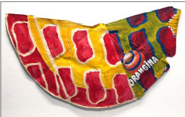
Claude VIALLAT, exposition Raboutage , 2009

► Support comme œuvre, devient lui-même l'œuvre