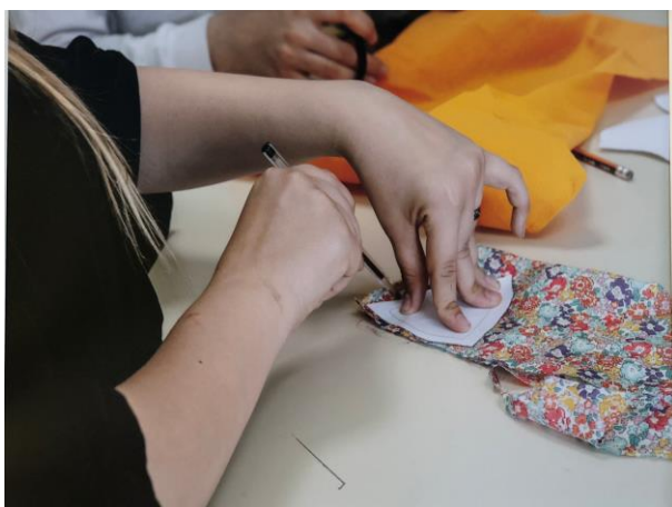
ILLUSTRATION DU PROJET PAR QUELQUES PHOTOS (Facultatif)