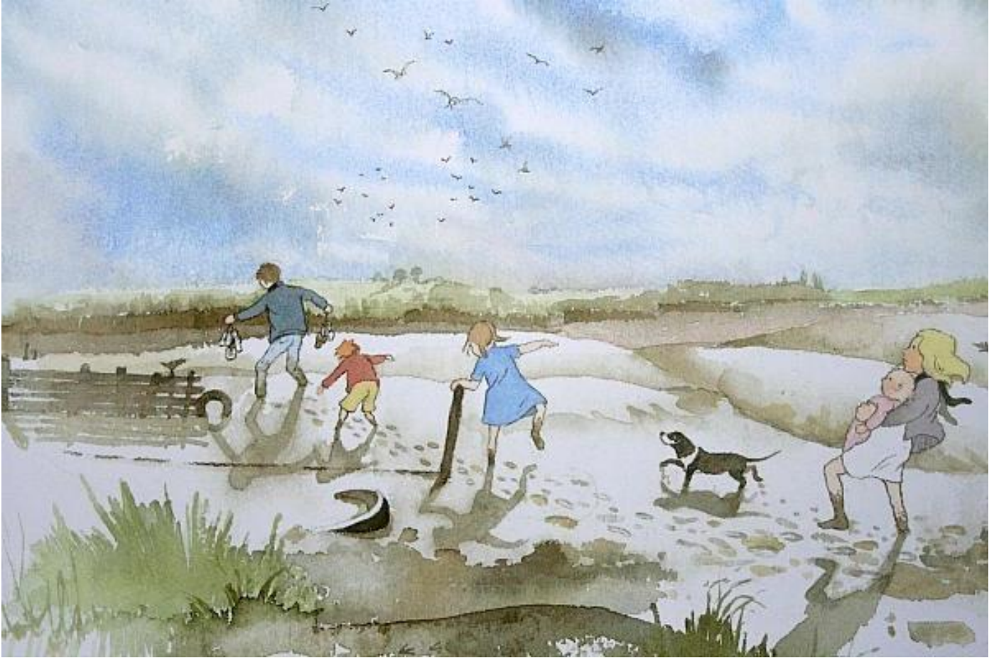
Illustration de l'album We're going on a Bear Hunt (Michael Rose and Helen Oxenbury, Walker Books)