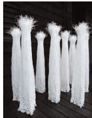
Kakuko Ishii, Mizuhiki I , 2007 exposition Asie Europe Art textile contemporaine (18 juin - 13 novembre 2011)

L'artiste japonaise Kakuko Ishii utilise une fibre végétale, le papier de riz, qu'elle tord en fines cordelettes reliées entre elles par des nœuds de différentes grosseurs dans un geste répétitif, proche de la méditation. Cet art du "mizuhiki" est un art traditionnel japonais ancien, que l'on retrouve dans les coiffures des samouraïs et des geishas et actuellement dans les emballages précieux des jours de cérémonie.