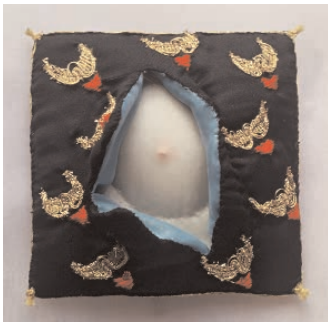
Marie-Thérèse Chevalier, Coussin d'Amour , soie, textiles, fils, couture, 11,5 x 11,5 x 6 cm 5 e triennale internationale des mini-textiles, "Le cœur d'amour épris", 1996