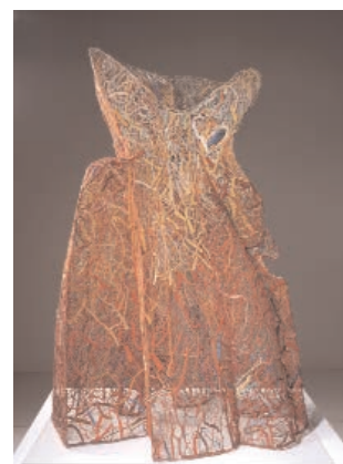
Marie-Rose Lortet, La robe de fête , 1998-99, 125 x 90 x 50 cm, coton solidifié

Véritable sculpture monumentale, cette œuvre 6 de Marie-Rose Lortet est constituée d'un réseau de fils tricotés, cousus, assemblés et mis en forme par un procédé d'empesage, qui lui donne de la tenue, à l'instar des cols de dentelle amidonnés des dames du passé. La souplesse naturelle des fils est niée au profit d'un ensemble monolithique et sculptural. L'artiste se plaît à bouleverser nos perceptions : le souple devient rigide, le léger devient lourd. La dentelle est séduisante, mais cette robe destinée à une fête ne permet pas de danser. Elle fait plutôt figure de carcan ou d'armure vide.