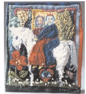
Baukje Zylstra, Herbs - Animal - Anima - Animus , pièces de tissus, broderie, 12 x 10,5 cm, 5 e triennale internationale des mini-textiles, "Le cœur d'amour épris", 1996