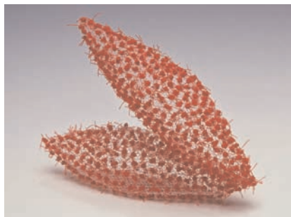
Masami Amano, Red Knot'96 - seed (Nœud rouge 96- Graine), tulle, polyester, nylon, fil de pêche - couture, nouage et colle - 8,5 x 11,5 x 3 cm - 5 e triennale internationale des mini-textiles, "Le cœur d'amour épris", 1996

Faire un nœud est probablement la manière la plus simple pour faire tenir deux fils souples ensemble 5 .