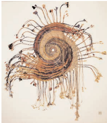
Guy Houdouin/Odon, Le Nautilus 2 de Patak II , 1991, diam. 2,50 m, papier kraft coloré, torsadé et tressé

Comment faire pour réunir des fibres afin de constituer un fil ou une corde ? Tordre et retordre, tresser à trois brins ou à brins multiples.