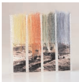
Regina Mazumdar, Des traces imaginaires , nylon, papier, laine, soie, tissage double, 12 x 12 cm - 6 e triennale internationale des mini-textiles "Un pas dans la lune", 1999

Pour faire tenir les fils entre eux, on peut encore les entrecroiser. Il suffit de tendre des fils (fils de chaîne) et d'en croiser d'autres perpendiculairement (fils de trame) en les glissant par-dessus, puis par-dessous. On crée ainsi un réseau de fils, un tissu. C'est la base du tissage sur laquelle les lissiers peuvent apporter toutes sortes de variations de textures en faisant jouer l'épaisseur des fils et des matériaux utilisés, en doublant les fils, en ajoutant des nœuds... Les artistes peuvent tisser de manière régulière ou irrégulière, jouer avec les vides, les espacements et créer ainsi des effets de transparence et d'opacité.