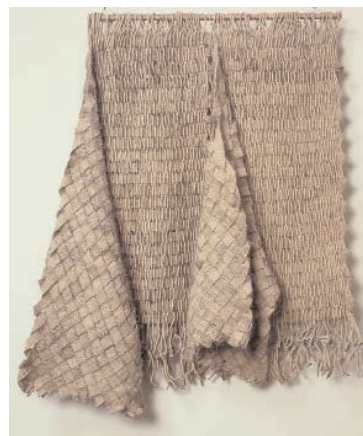
Olga de Amaral, Manteau de Calicanto , 1977, crin, laine et coton, 1,35 x 1 m

La chaîne est par elle-même espace et volume : une matière à pénétrer, à plier aux exigences de nouvelles structures tridimensionnelles [...] Puisque sa destinée finale est d'être présente à l'intérieur d'une construction, elle devient automatiquement élément d'architecture.