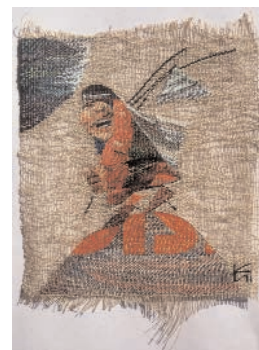
Irina Kolesnikova, Red traces , lin, soie, tissage main, 12 x 10,7 cm - 6 e triennale internationale des mini-textiles "Un pas dans la lune", 1999