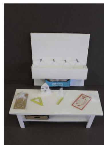
Photo-souvenirs de travaux et de salles d'arts plastiques en 2017-2018