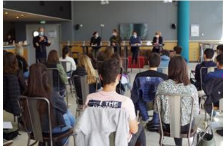
Des femmes civiles et militaires du groupement de soutien de la base de défense de Pau-Bayonne ont rencontré la CDSG de 1 re « sciences et technologies de management et de la gestion » du lycée Jules Supervielle d'Oloron.