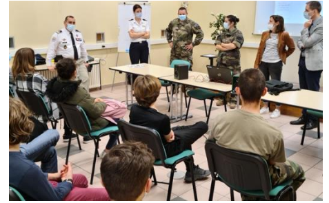
Le personnel féminin de la délégation militaire, du centre d'information et de recrutement des forces armées et du centre du service national et de la jeunesse des Pyrénées-Orientales ont rencontré les élèves du collège Mme de Sévigné à Perpignan.