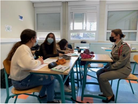
Une délégation de personnel féminin du 1 er régiment de hussards parachutistes de Tarbes a rencontré les élèves de la section générale et professionnelle adaptée du collège Pierre Mendès France à Vic-en-Bigorre.