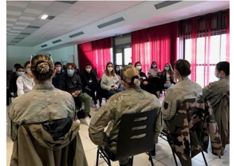
Des militaires féminines du 1 er régiment de parachutistes d'infanterie de marine de Bayonne ont rencontré la CDSG du lycée Sud des Landes à Saint-Vincent de Tyrosse.