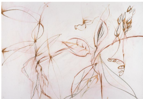
3 Daniel DEZEUZE, La Vie amoureuse des plantes , 1992, Mine graphite, terre de Cassel, craies et encres de couleur sur papier, 75 x 109,5 cm