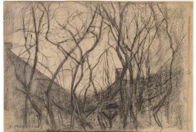
2 Piet MONDRIAN, Étude d'arbres , 1905-1906, Fusain sur papier, 19x27,5 cm

Vous pouvez compléter avec vos propres mots