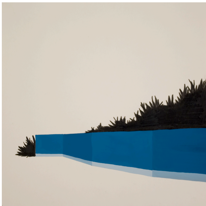
Sans titre* EAD28 2006-2007 gouache sur papier 32 x 32 cm 2008 Acquisition Le Ring, artothèque 2010 Collection Ville de Nantes Dépôt ESBANM