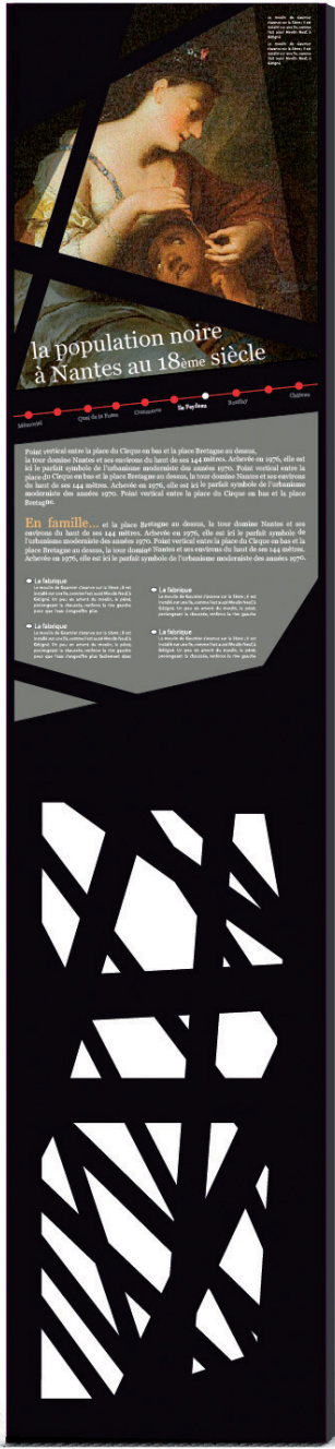
Le mobilier de parcours urbain sur la traite négrière

économique qu'urbain. Il met en lumière les acteurs de la traite négrière. Sont également présentées l'histoire des abolitions en France et les résistances aux abolitions. La signalétique évoque aussi l'esclavage contemporain et le travail de mémoire engagé à Nantes depuis 25 ans et dont le Mémorial constitue une étape majeure.