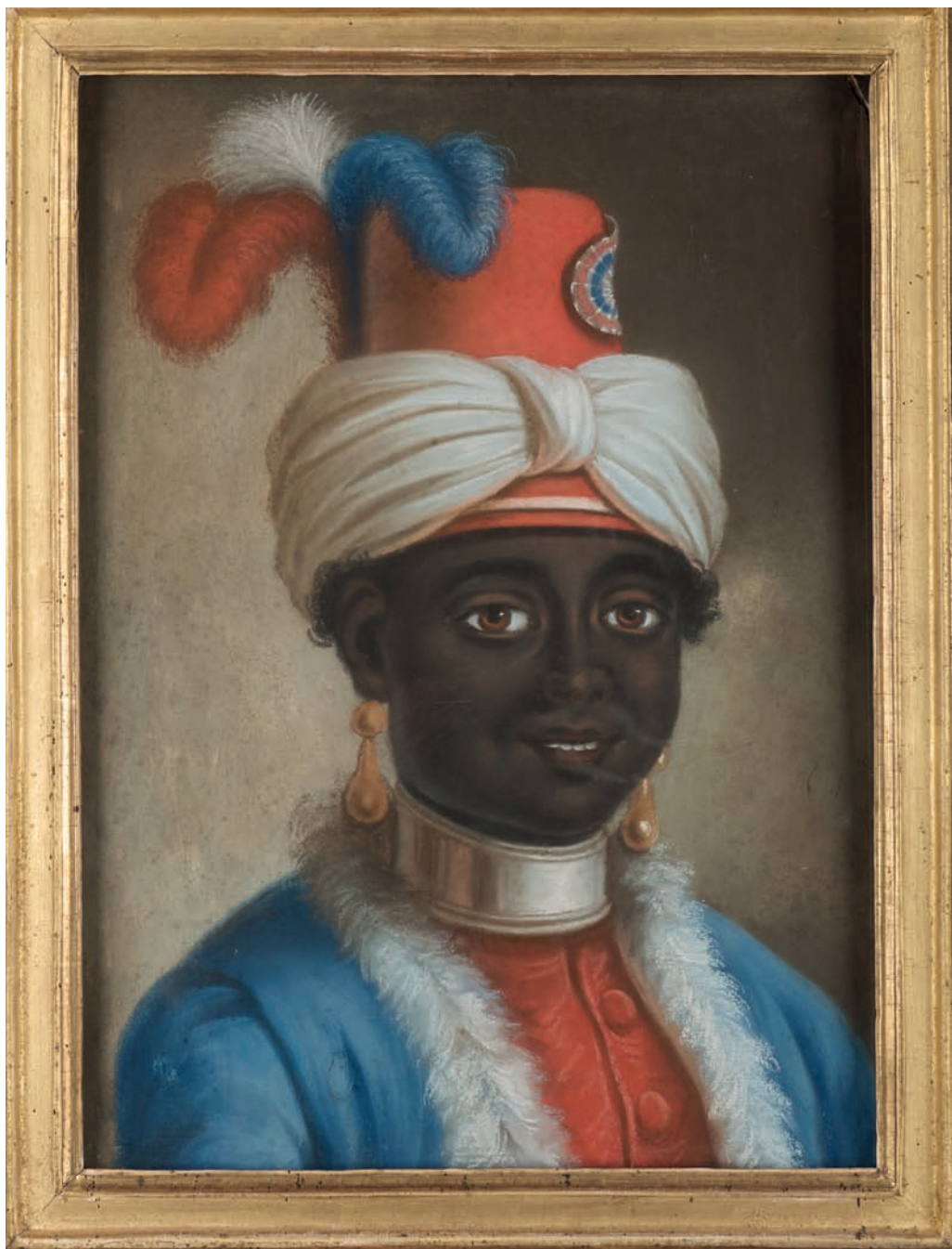
Jeune esclave en habit républicain - Musée d'histoire de Nantes