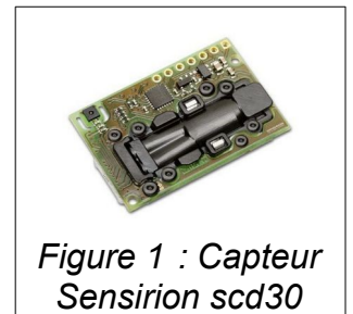
Figure 1 : Capteur Sensirion scd30

On se propose ici de développer un algorithme et un programme en Python permettant de gérer les mesures données par un capteur de CO 2 de type NDIR (principe de l'absorption dans l'infrarouge non dispersif).